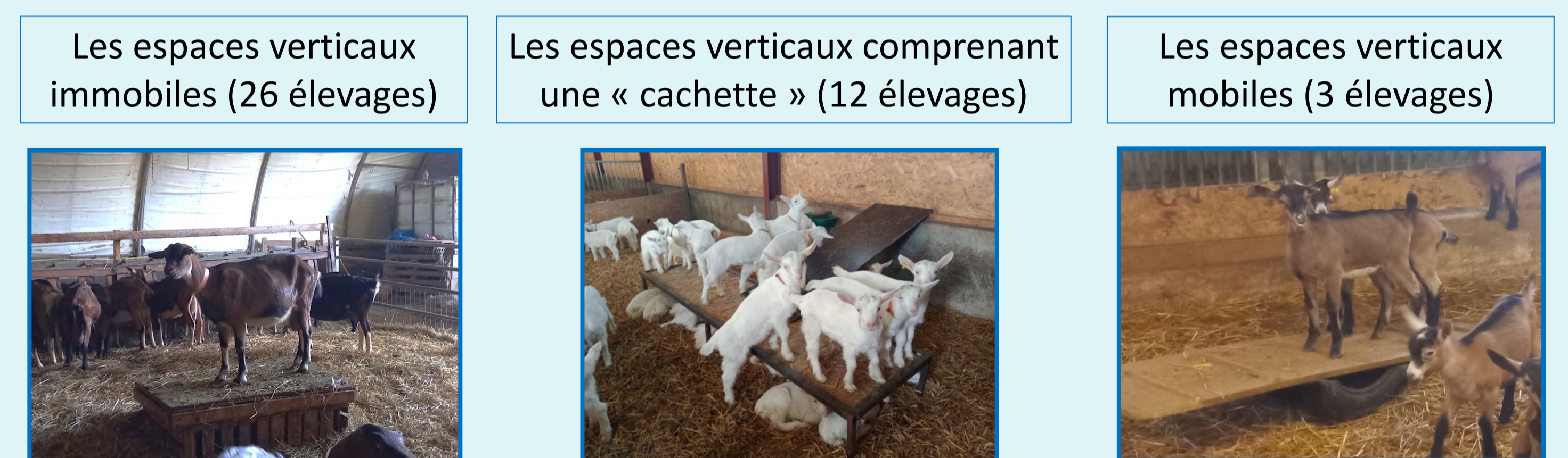
Figure 3: Les différents types d'espaces verticaux rencontrés

Des espaces verticaux (plateformes, bancs...) ont été observés dans 29 élevages et présentent une forte diversité (Fig. 3). Ils permettent, selon les éleveurs possédant ces aménagements, la réalisation de différents comportements : grimper, jouer, mettre en place la hiérarchie, se cacher.